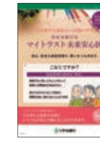
お客さまとお客さまの大切な方のために、ご資金を守り、未来に安心をつなぎます。