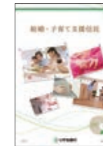
結婚・子育て資金の一括贈与にかかる贈与税がお子さまやお孫さま等一人あたり1,000万円まで非課税となります。