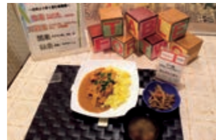
社員食堂でヘルシーメニューを注文すると、1食あたり20円が開発途上国の子どもたちの学校給食費として寄付される取り組みで、これまでに65万食を超えました。