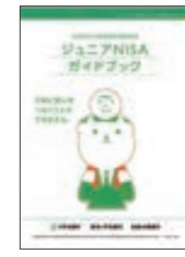
お子さま一人あたり年間80万円までの株式投資信託や上場株式への少額投資で得られる収益が非課税となります。 ※当グループでは、上場株式の取り扱いはありません。