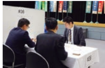
「食」をテーマに各地の特色ある食材を集めた商談会で、今回は過去最多となる9都府県の企業が集結しました。