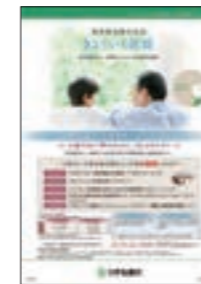
教育資金の一括贈与にかかる贈与税がお孫さま等一人あたり1,500万円まで非課税となります。