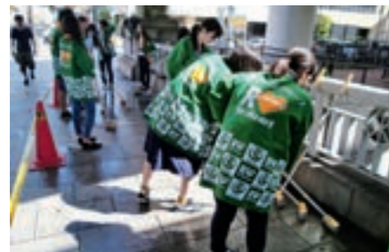
2012年に発足後、地域ボランティアや環境ボランティア等様々な活動を行っています。