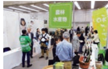
関西を中心とした9府県の地場名産・名物を取り扱う事業者、50先が一堂に集結し出展。一般消費者を含む約1,000名の方が来場し、地域PRにも繋がりました。