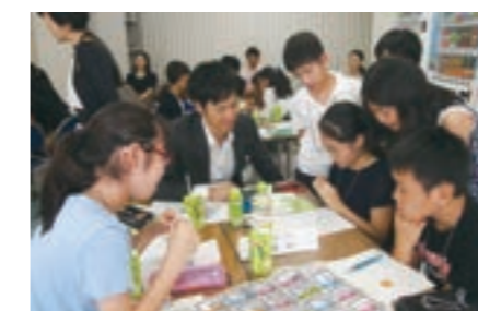
2005年にスタートし、卒業生は25,000人を超えています。