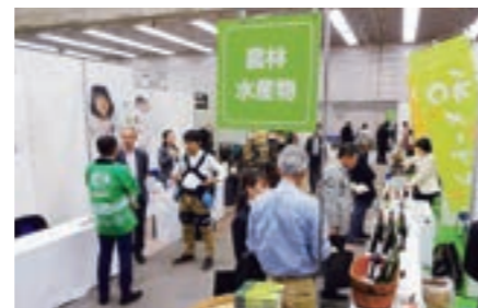
関西を中心とした9府県の地場名産・名物を取り扱う事業者、50先が一堂に集結し出展。一般消費者を含む約1,000名の方が来場し、地域PRにも繋がりました。