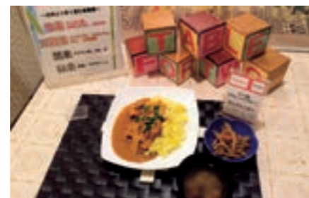
社員食堂でヘルシーメニューを注文すると、1食あたり20円が開発途上国の子どもの学校給食費として寄付される取り組みで、これまでに65万食を超えました。