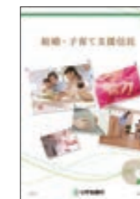
結婚・子育て資金の一括贈与にかかる贈与税がお子さまやお孫さま等一人あたり1,000万円まで非課税となります。