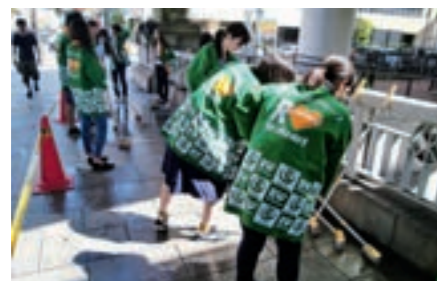
2012年に発足後、地域ボランティアや環境ボランティア等様々な活動を行っています。