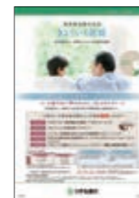
教育資金の一括贈与にかかる贈与税がお孫さま等一人あたり1,500万円まで非課税となります。