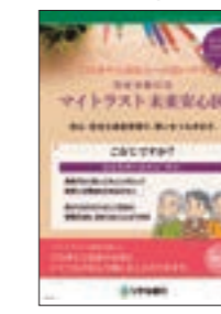
お客さまとお客さまの大切な方のために、ご資金を守り、未来に安心をつなぎます。