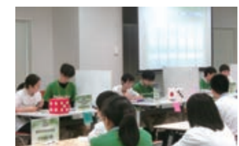
東京、埼玉、大阪の3つの地方大会を開催し、金融知力の普及・向上に役立ててもらっています。